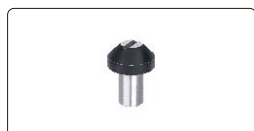
soporte tipo V (opcional) para diámetros Ø2~4mm