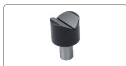
soporte tipo V (incluido) para diámetros Ø4~60mm