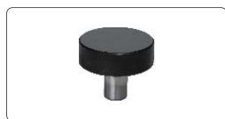
yunque plano Ø60mm (incluido)