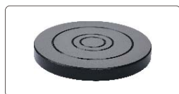
yunque plano Ø150mm (incluido)